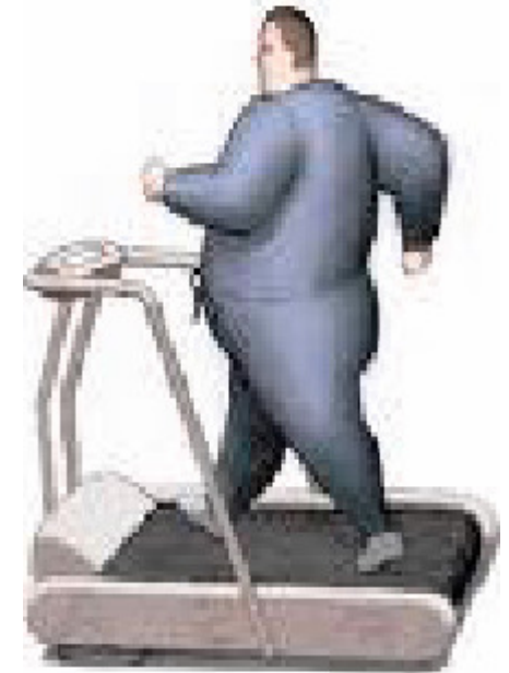
Ejercicio, ejercicio y más ejercicio.

4) La influencia familiar y el apoyo es importante, ya que cuando hay padres obesos es mayor la probabilidad que los hijos padezcan esta enfermedad, por los malos hábitos alimenticios.