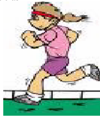
Cualquier Deporte es importante

6) Haga 30 minutos de ejercicios regularmente todos los días.